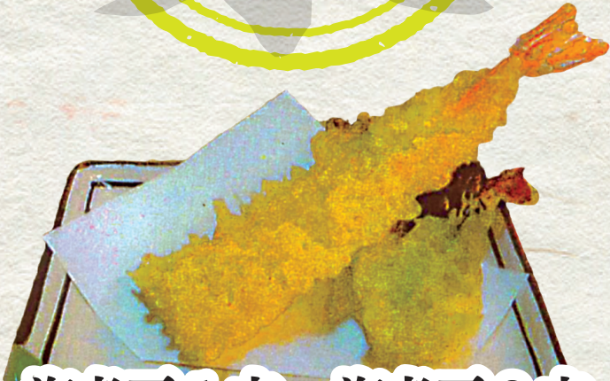
海老天1本 海老天3本